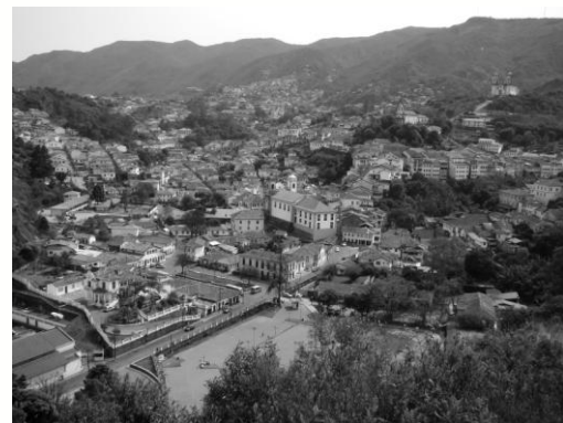
Vista panorâmica do Morro da força