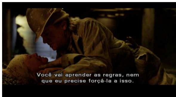
Figura 3 Cena do filme Terra fria em que ocorre assédio sexual para com Josey.

Esse conceito denota o desprezo, aversão, ódio à mulher e ao feminino. A misoginia é um padrão aprendido que pode ser abandonado, caso as ideias e valores que o fundamentam sejam criticados e transformados (CARVALHO et al., 2009). Esse conceito pode ser relacionado em diversas cenas do filme que mostra as formas de provocações, xingamentos, abusos malicioso e palavras, de baixo calão, rabiscadas nas paredes (vadias), mostrando o quanto a misoginia é forte em espaços sociais ditos masculinos, ou seja, a aversão de desprezo para com as mulheres.