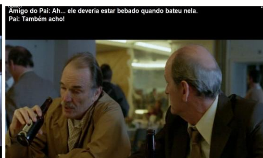
Figura 2 - Cena do filme Terra Fria em que o pai da personagem principal e o amigo dele defendem o marido agressor.