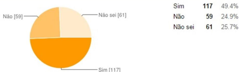
Gráfico 6: Nossa divulgação é adequada? Você tem facilidade em saber nossa programação?

visual que dialogue com os diversos públicos, além de diversificar os meios de divulgação.