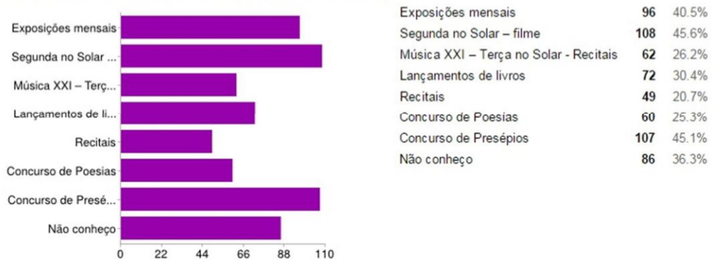
Gráfico 4: Você conhece as atividades fixas do Centro Cultural da UFSJ?

É possível verificar que a grande maioria dos entrevistados conhece as atividades oferecidas pelo Centro, diferentemente do observado por Tabosa (2012) em um trabalho sobre um Centro Cultural de Fortaleza, onde verificou-se uma falta de contato entre o Centro e seu público. Nota-se que esta questão permite-nos observar a inserção do CCUFSJ na comunidade.