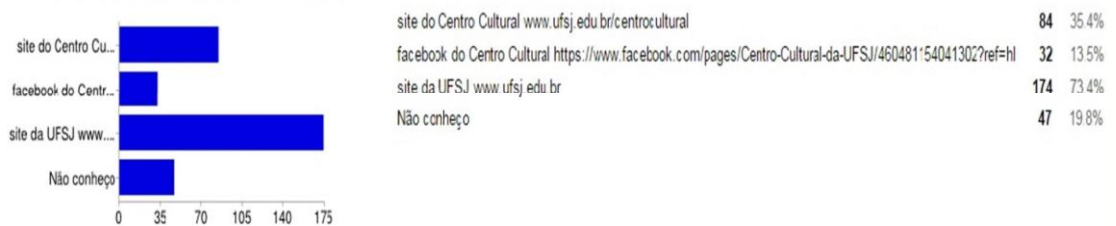
Gráfico 5: Você conhece nossos principais meios de divulgação?

É possível verificar que a grande maioria dos entrevistados conhece as atividades oferecidas pelo Centro, diferentemente do observado por Tabosa (2012) em um trabalho sobre um Centro Cultural de Fortaleza, onde verificou-se uma falta de contato entre o Centro e seu público. Nota-se que esta questão permite-nos observar a inserção do CCUFSJ na comunidade.