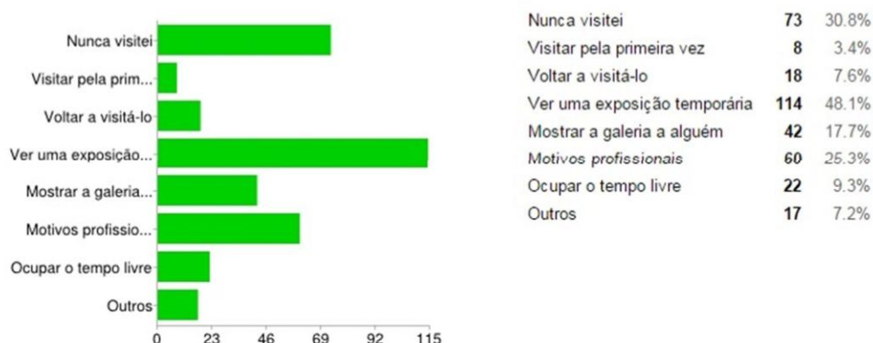
Gráfico 3: Quais os motivos o levaram a visitar o Centro Cultural da UFSJ?

Nota-se que a maioria dos entrevistados foram atraídos ao Centro para visita à exposições, sendo que este tipo de evento é oferecido com frequência, totalizando no primeiro semestre de 2015 em 9 exposições, como observado no Quadro 2. Estas exposições têm abrangido diversas temáticas como, por exemplo, exposição de fotos, de esculturas bi e tridimensionais, pinturas, assemblages e diversas outras técnicas das artes plásticas. Além das diferentes técnicas que foram expostas, no ano de 2015 tivemos a Mostra Queer de Artes , projeto de extensão que visa discutir questões de gênero e sexualidade através de exposições fotográficas, palestras, debates, teatro, dança e música. Foi um mês com atividades intensas e recepção muito positiva da comunidade em geral que tiveram chance de entender melhor questões sobre diversidade que são tão contemporâneas. Também contamos com a exposição dos alunos formandos no curso de Artes Aplicadas da UFSJ. Os alunos expuseram seus projetos de conclusão de curso e dessa forma já tiveram contato com o mercado de artes e a experiência de montar uma exposição. As exposições na Galeria Principal duram em torno de 30 dias e na Galeria Escada duram 45 dias.