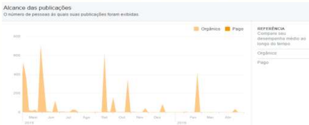
Gráfico 1 – Gráfico mostrando o alcance das publicações, fornecido pelo Facebook.

O papel informativo das mídias sociais, através da divulgação das datas e eventos comemorativos da cidade (Figura 7), veio também a somar na apropriação e revitalização da história e do patrimônio cultural da cidade, potencializando e despertando o interesse do público em conhecê-los.