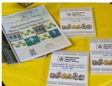
Figura 6 - Catalogação em formato impresso e CD.

Após a efetivação da construção do banco de dados, alimentados com todas as informações necessárias, e da inserção de todas as informações no DONATO 3.0, foi promovida a entrega da catalogação do acervo artístico e catálogo das peças dos Museus à municipalidade areense, em forma impressa e formato de mídia digital (Figura 6).