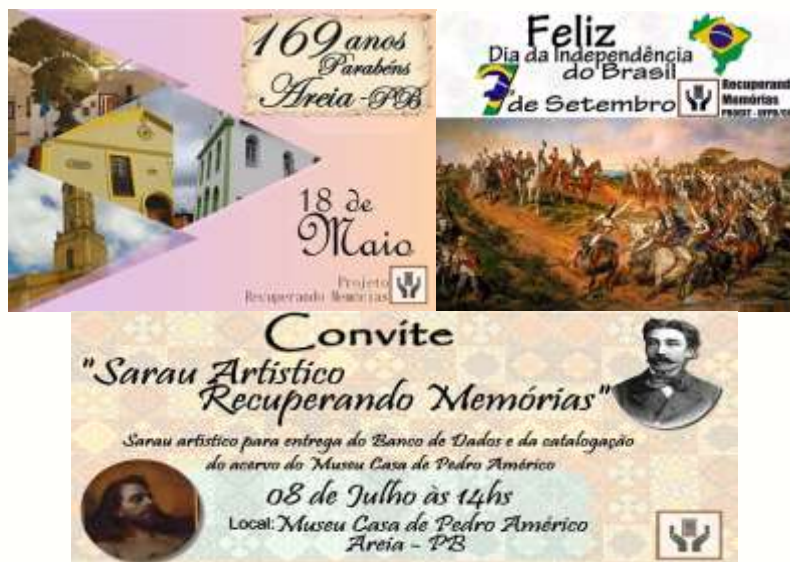
Figura 7 – Artes de divulgação das mídias sociais.

O papel informativo das mídias sociais, através da divulgação das datas e eventos comemorativos da cidade (Figura 7), veio também a somar na apropriação e revitalização da história e do patrimônio cultural da cidade, potencializando e despertando o interesse do público em conhecê-los.